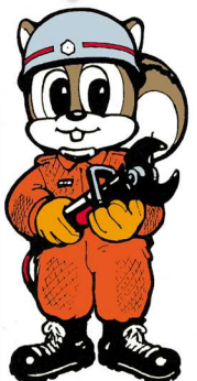
札幌市消防局 マスコット 「リスキュー」